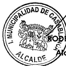
RODRIGO MARTINEZ ROCA Alcalde de Casablanca